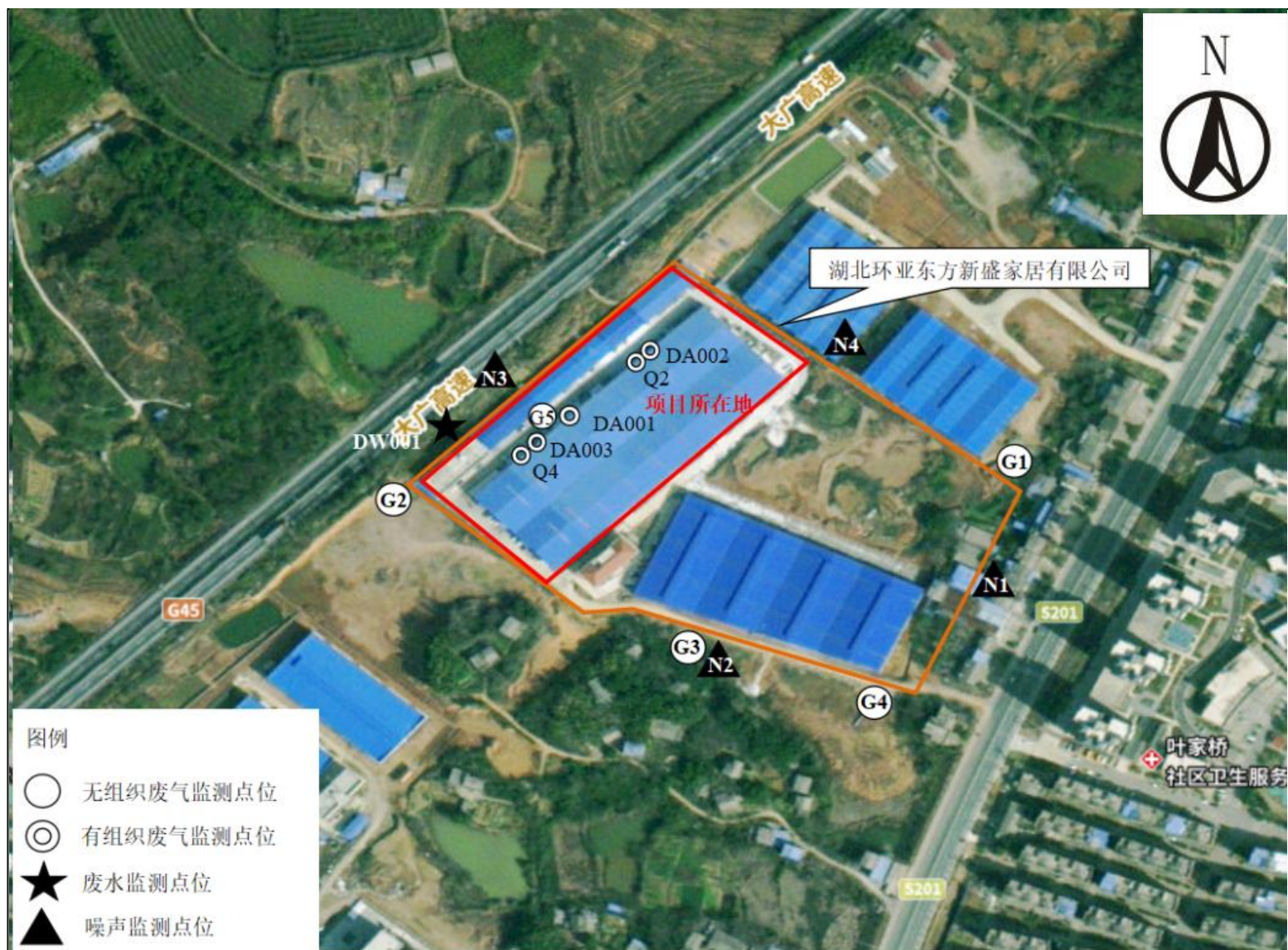
附图4 项目监测点位图