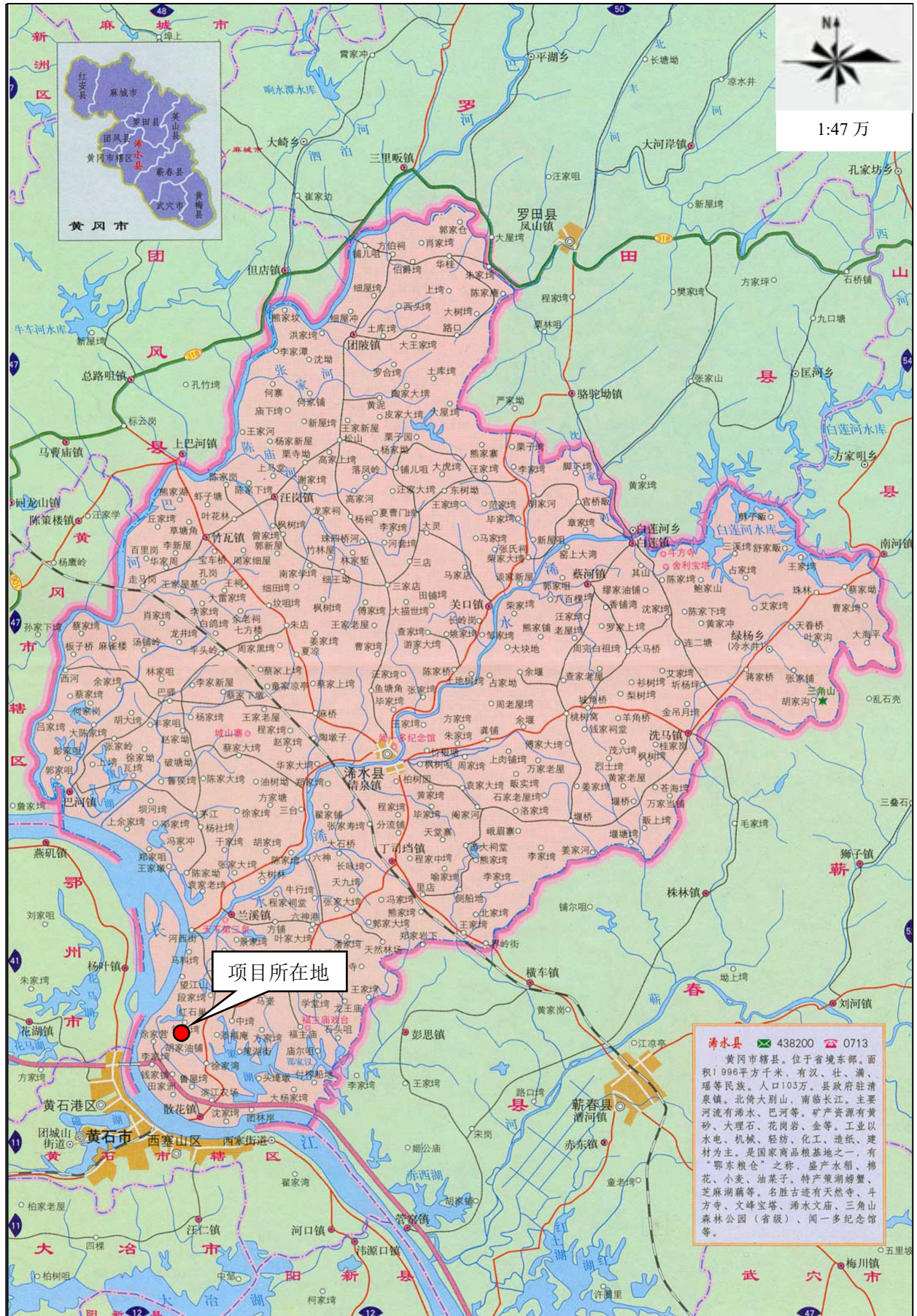
附图1 项目地理位置图