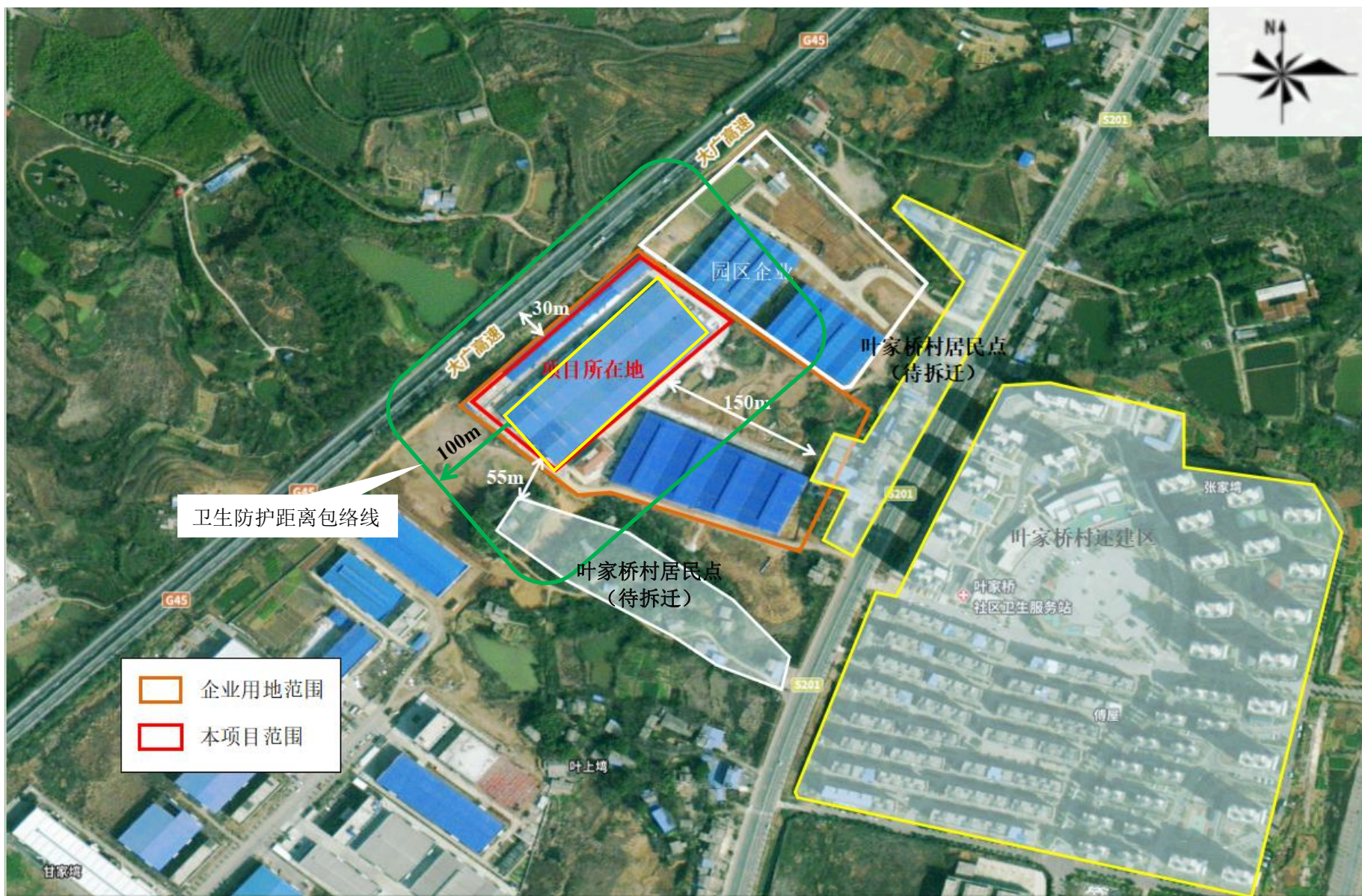
附图5 项目卫生防护距离包络线图