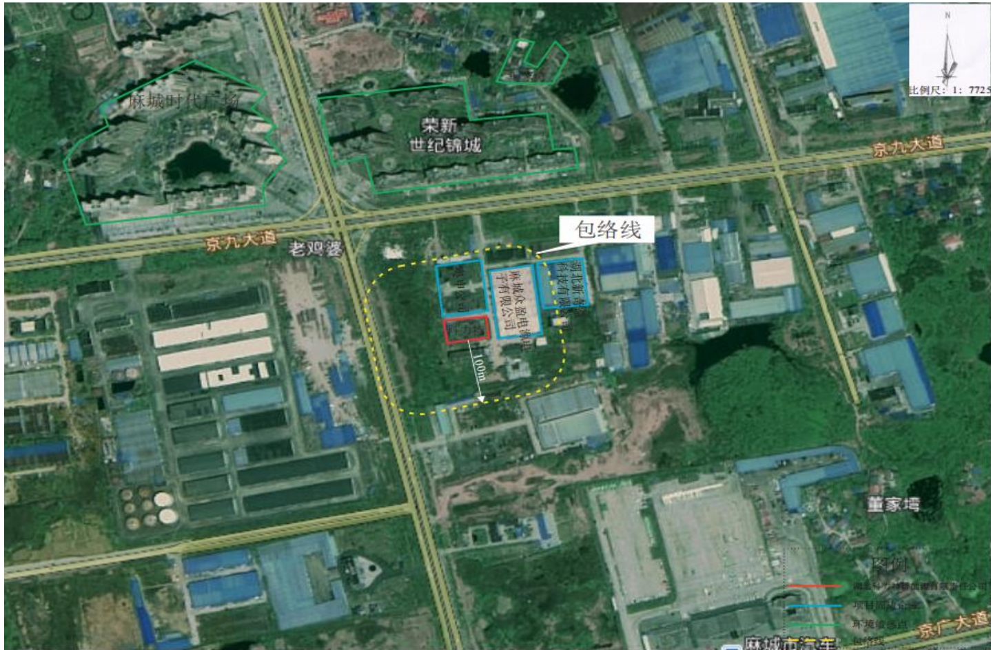
附图 5 项目卫生防护距离示意图