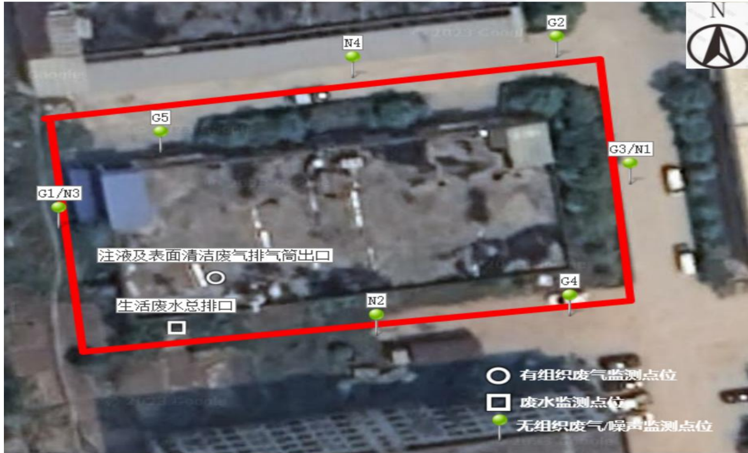
附图4 项目验收监测点位示意图