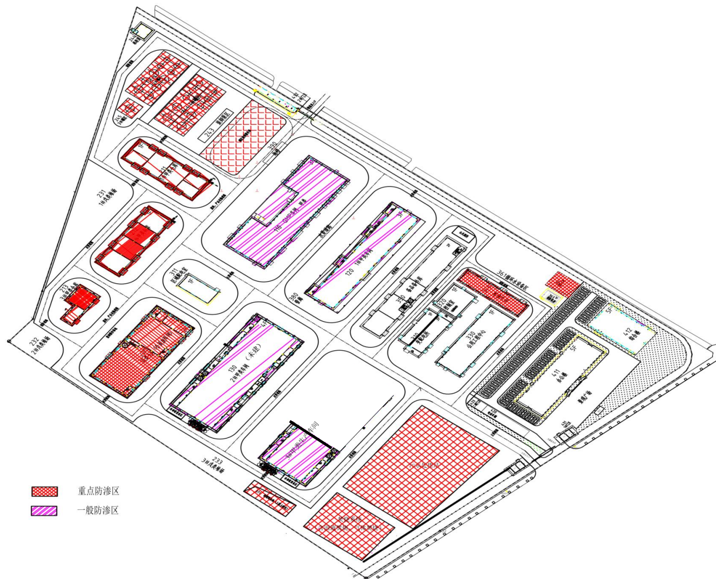
附图5 项目厂区分区防渗图