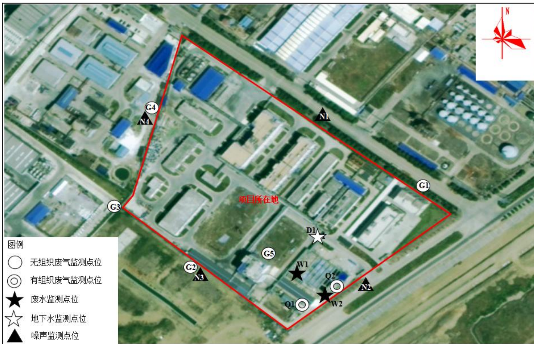
附图 6 项目监测点位图