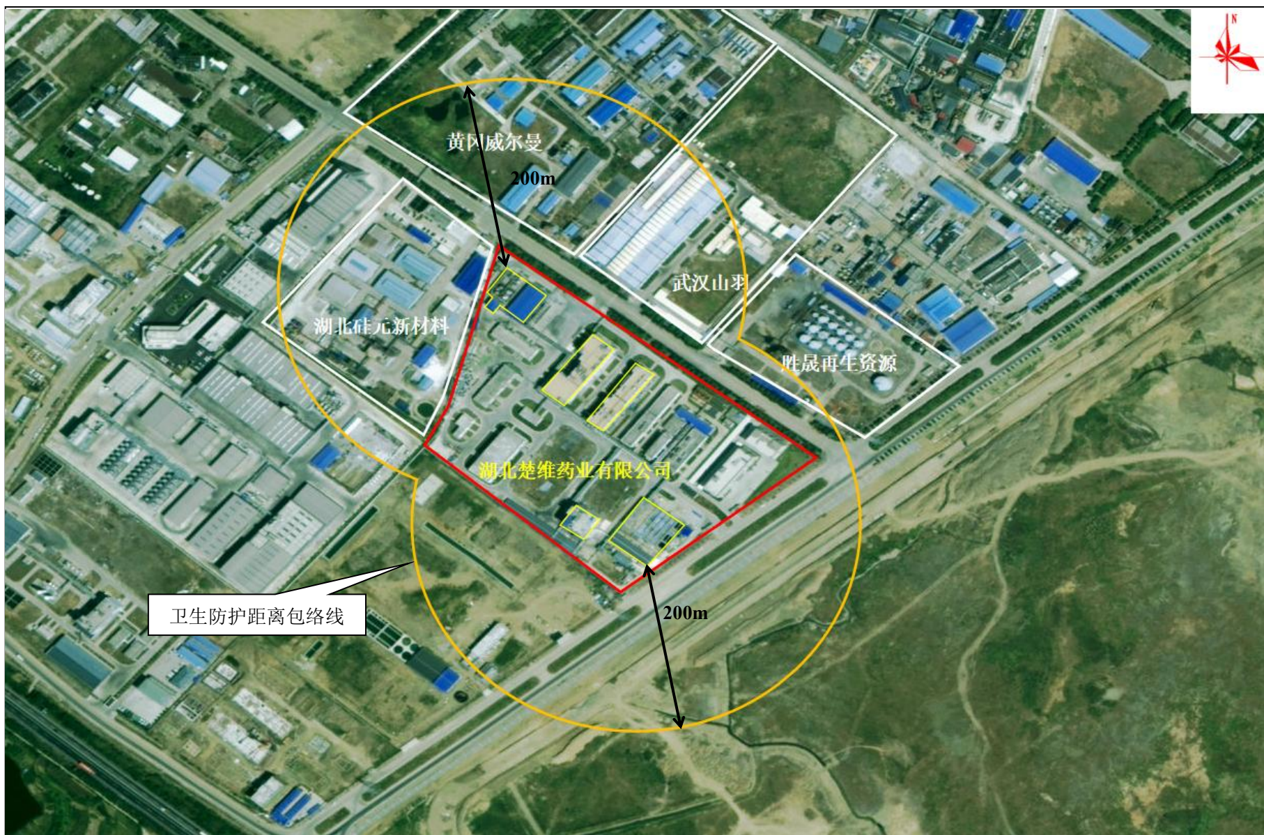
附图 7 卫生防护距离包络线图