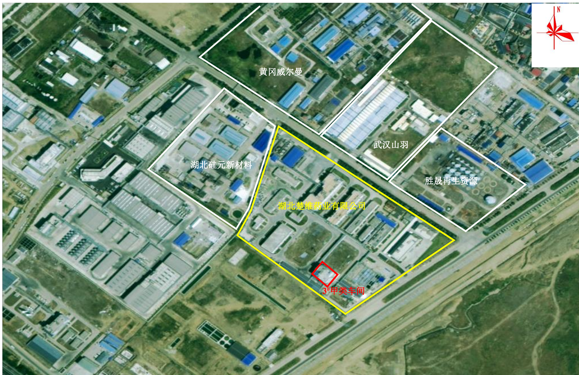
附图2 项目周边关系示意图