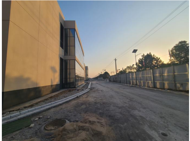
项目南侧现状（空地）