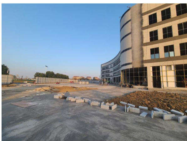
项目建设现状（待绿化现状）