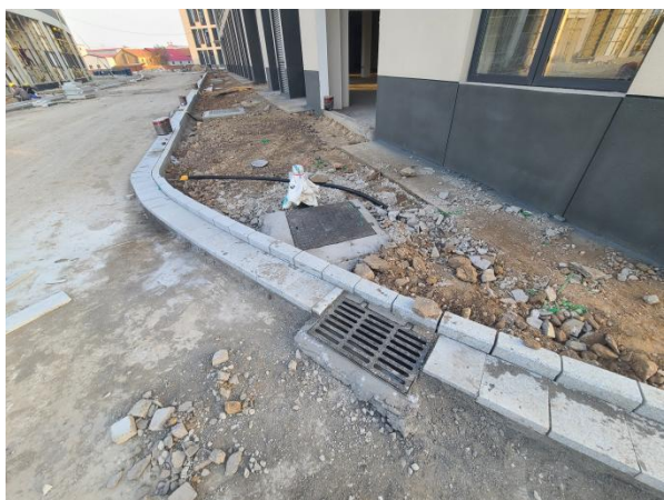
项目建设现状（已建沉沙池）