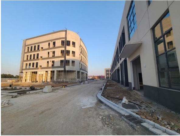
项目东侧现状（紧邻正飞生物）