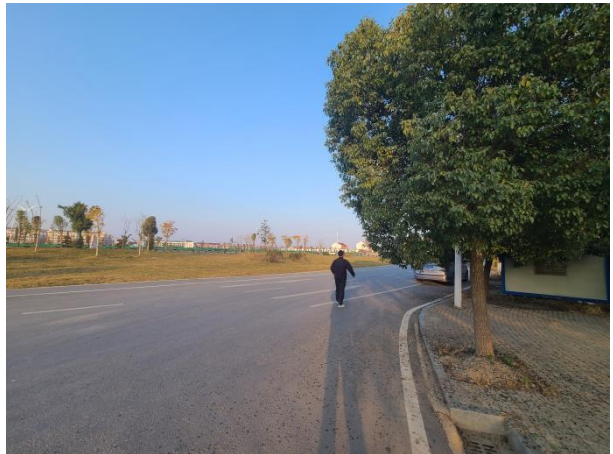
项目北侧现状（公路）