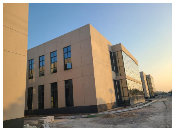
项目建设现状（已建厂房）