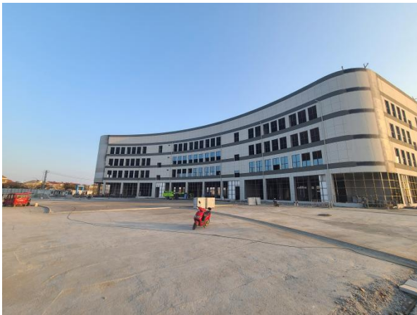
项目建设情况（已建1栋研发中心）