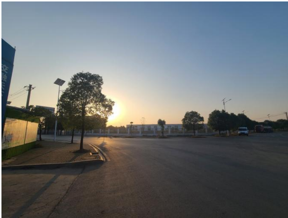
场地西侧现状（公路）