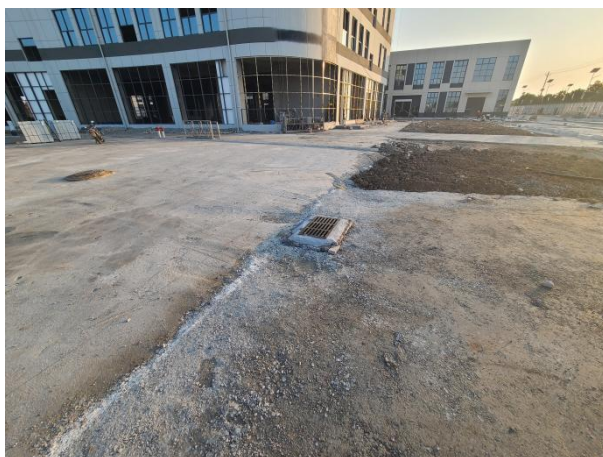
项目建设现状（已建排水管网）